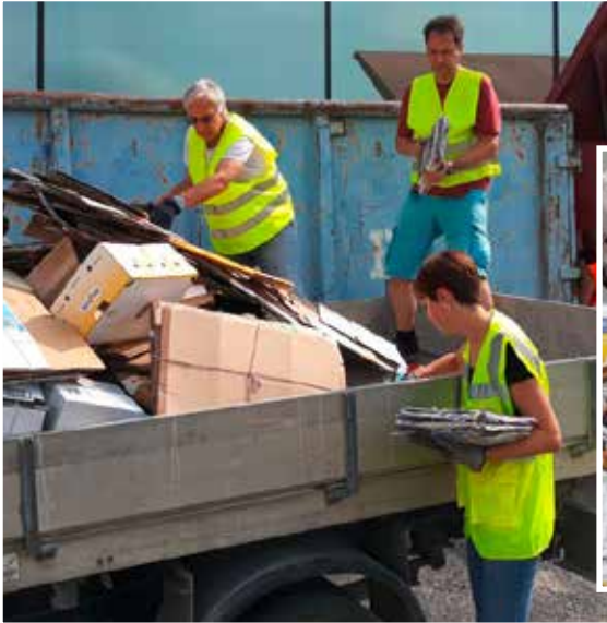
Action bei der Papiersammlung